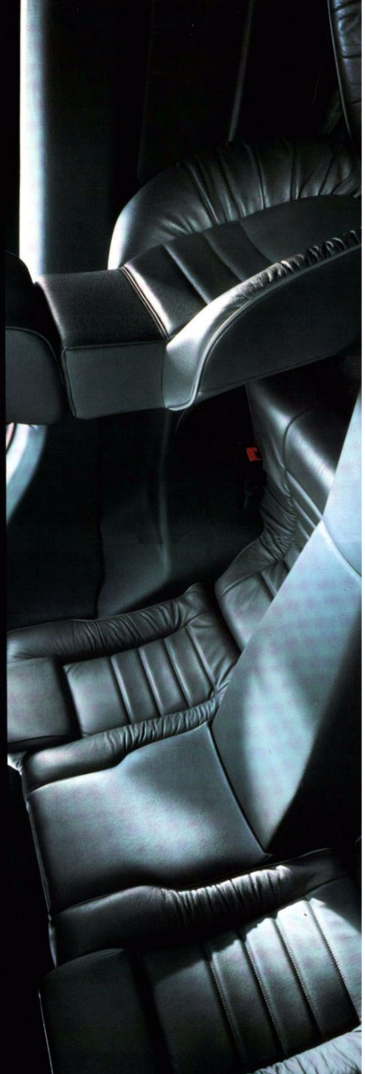
CD-Player und Lederpolsterung auf Wunsch.