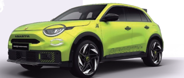
VERDE DARING 0€