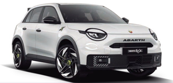
BLANCO GARA 0€