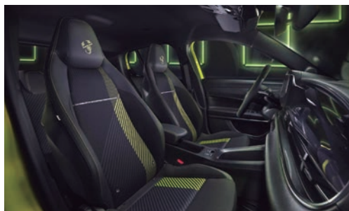
ASIENTOS DEPORTIVOS SABELT Tejido deportivo con reposacabezas integrados