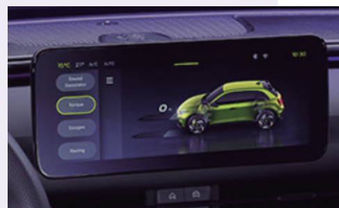
NAVEGADOR Pantalla táctil Uconnect™ de 26 cm (10,25")