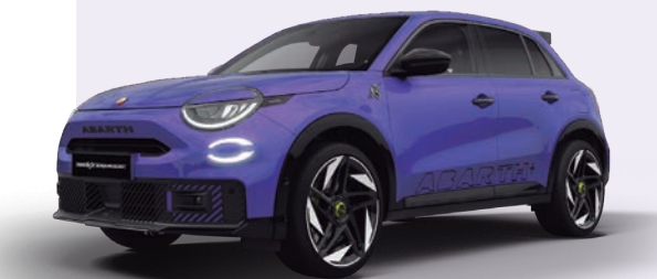
PURPURA HIPNÓTICO 0€