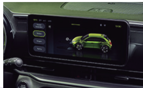
RADIO Pantalla táctil Uconnect™ Radio de 26 cm (10,25")