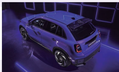
EXCLUSIVO COLOR Una cautivadora fusión de audacia, vitalidad y puro magnetismo. Este nuevo diseño, refleja el alma de un Escorpión nacido para destacar entre la multitud, robando el centro de atención allá donde vayas con su llamativo y profundo resplandor púrpura.