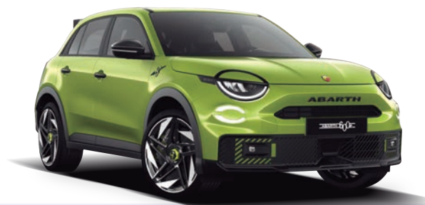
VERDE DARING 700€