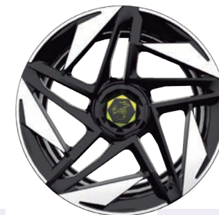
LLANTAS De aleación 50,8 cm(20")