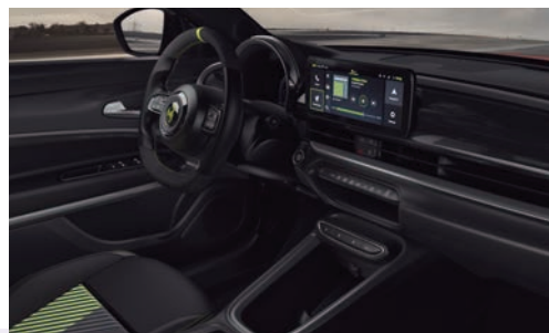
VOLANTE DEPORTIVO En Alcántara